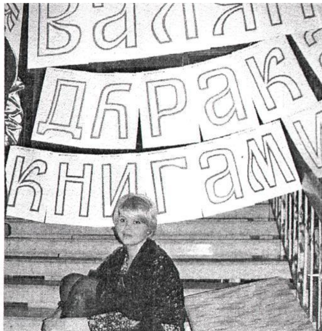
Здесь валяли дурака книгами